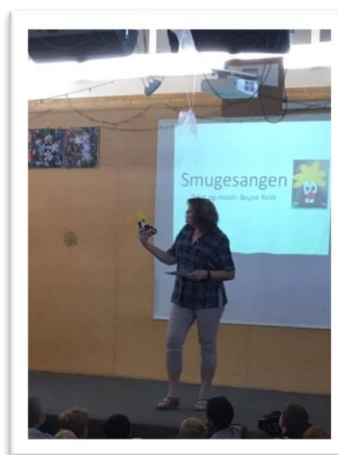
Søagerskolens maskot, "Smugen" flytter ind på Boesagerskolen

Til dem, der ikke kender "Smugen", kan det kort fortælles, at det er et lille væsen, som bor alle vegne på skolen. Den trives bedst i et rart miljø og med hjælpsomme og imødekommende børn og voksne omkring sig.