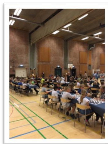
Skakturnering i Distriktskole Smørum

Vi glæder os allerede til endnu en dyst i efteråret.