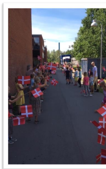
Modtagelse på afd. Boesagerskolen

På Boesagerskolen mødtes alle indskolingseleverne til fællessamling, og hér flyttede Søagerskolens maskot, "Smugen" også ind. "Smugens historie blev fortalt og sangen om Boesagerskolens "Smuge" blev sunget for første gang.